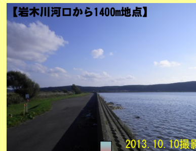
【岩木川河口から1400m地点】