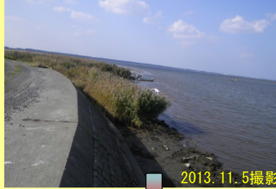
【岩木川河口から200m地点】