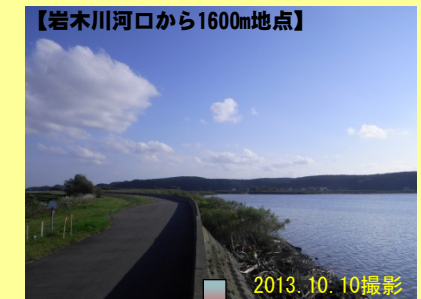
【岩木川河口から1600m地点】