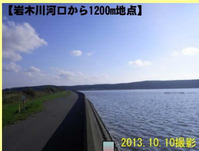
【岩木川河口から1200m地点】