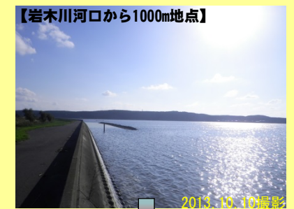
【岩木川河口から1000m地点】