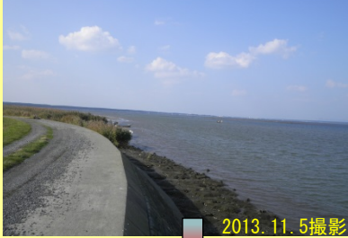
【岩木川河口から160m地点】