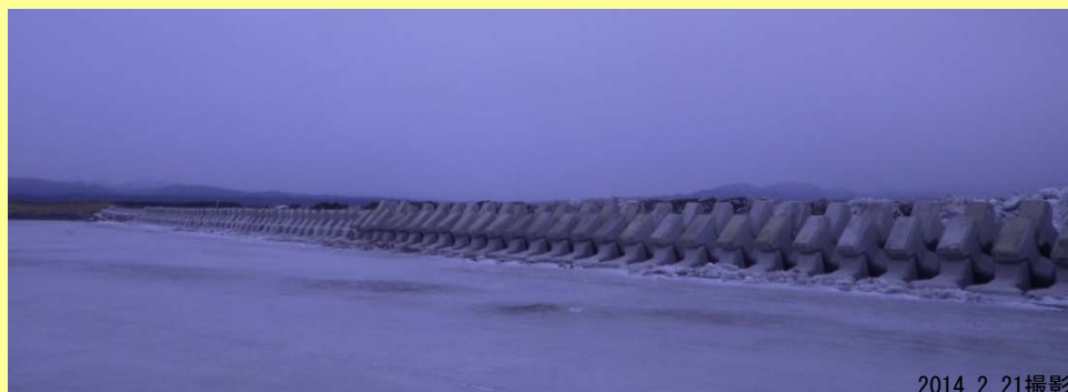
2014. 2. 21撮影