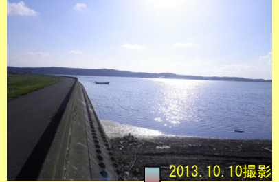
【岩木川河口から550m地点】