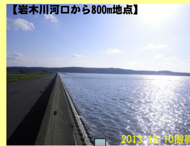
【岩木川河口から800m地点】