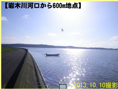
【岩木川河口から600m地点】